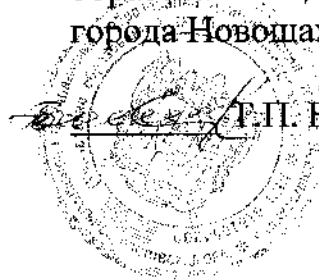
ГРАФИК обследования и приемки образовательных учреждений города Новошахтинска представителями Отдела МВД России по г.Новошахтинску к новому 2014-2015 учебному году