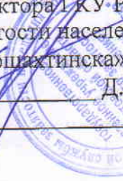
График выездов МОЦЗН ГКУ РО «Центра занятости населения города Новошахтинска» по оказанию комплекса услуг по профессиональной ориентации и содействию занятости молодежи в 2020-2021 году